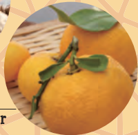
柚子 Yuzu citrus