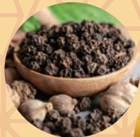
山椒 Sansyo pepper