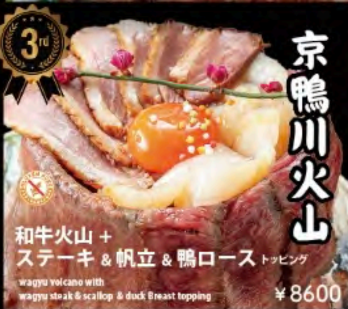
和牛火山 + ステーキ & 帆立 & 鴨ロース トッピング wagyu volcano with wagyu steak & scallop & duck Breast topping