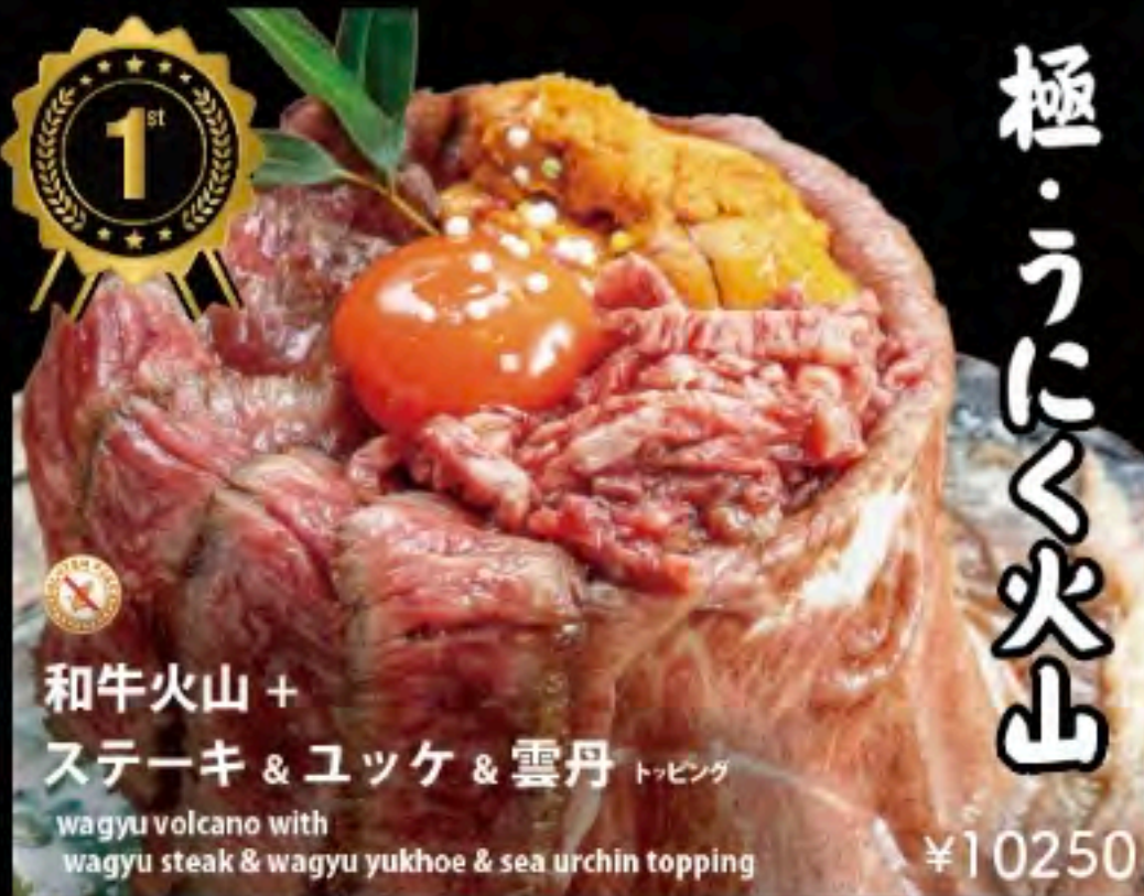
和牛火山 + ステーキ & ユツケ & 雲丹 トッピング wagyu volcano with wagyu steak & wagyu yukhoe & sea urchin topping