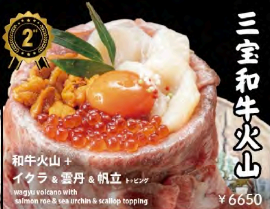
和牛火山 + イクラ & 雲丹 & 帆立 トッピング wagyu volcano with salmon roe & sea urchin & scallop topping