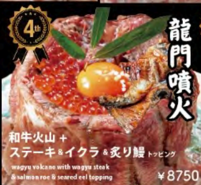
和牛火山 + ステーキ & イクラ & 炙り鰻 トッピング wagyu volcano with wagyu steak & salmon roe & seared eel topping