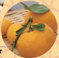
柚子 Yuzu citrus