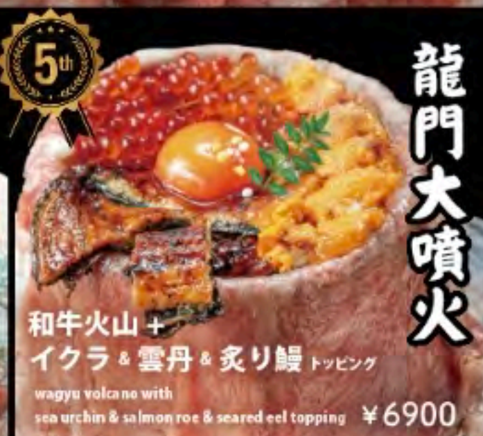
和牛火山 + イクラ & 雲丹 & 炙り鰻 トッピング wagyu volcano with sea urchin & salmon roe & seared eel topping