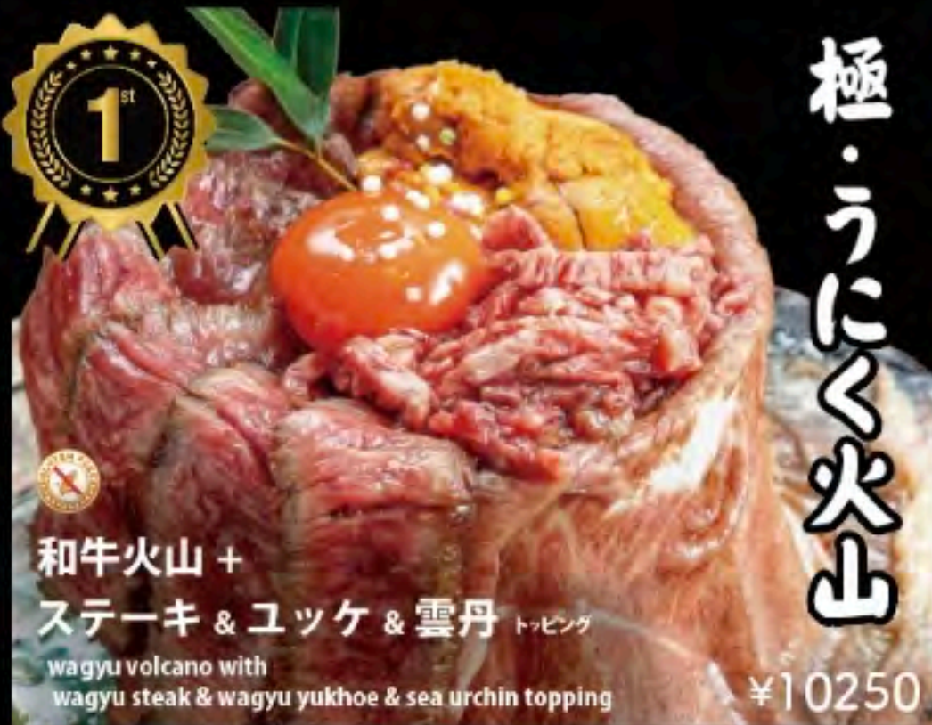
和牛火山 + ステーキ & ユッケ & 雲丹 トッピング

wagyu volcano with wagyu steak & wagyu yukhoe & sea urchin topping