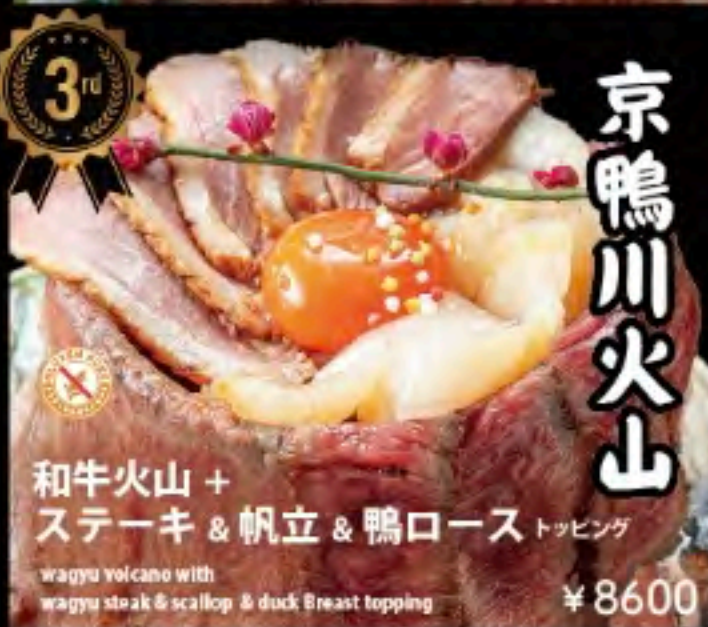
和牛火山 + ステーキ & 帆立 & 鴨ロース トッピング

wagyu volcano with wagyu steak & scallop & duck Breast topping