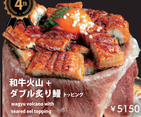
和牛火山 + ダブル炙り鰻 トッピング