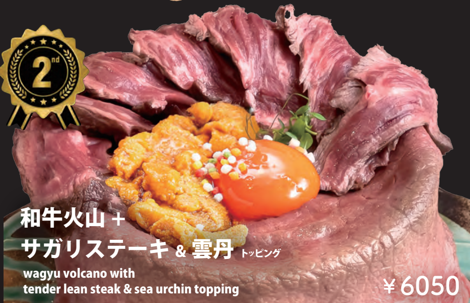
和牛火山 + サガリスステーキ & 雲丹 トッピング

wagyu volcano with tender lean steak & sea urchin topping