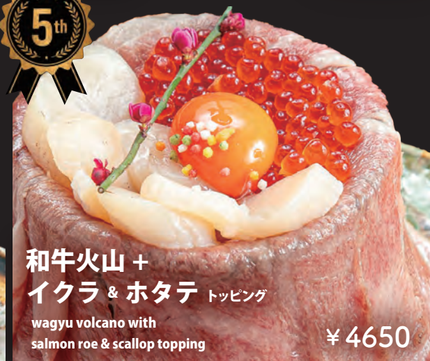
和牛火山 + イクラ & ホタテ トッピング

wagyu volcano with salmon roe & scallop topping