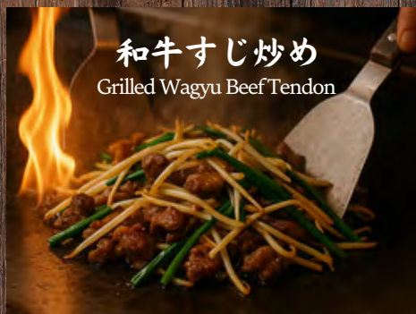
和牛すじ炒め Grilled Wagyu Beef Tendon

北海道ホタテのバター焼き 4pc ¥1600 Butter-grilled Scallop from Hokkaido 4pc 北海道黄油烤扇贝 (四个)