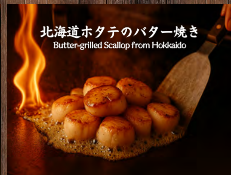
北海道ホタテのバター焼き Butter-grilled Scallop from Hokkaido