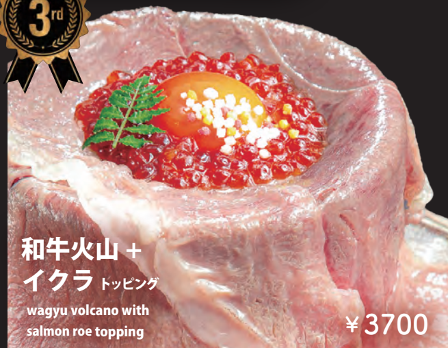
和牛火山 + イクラ トッピング