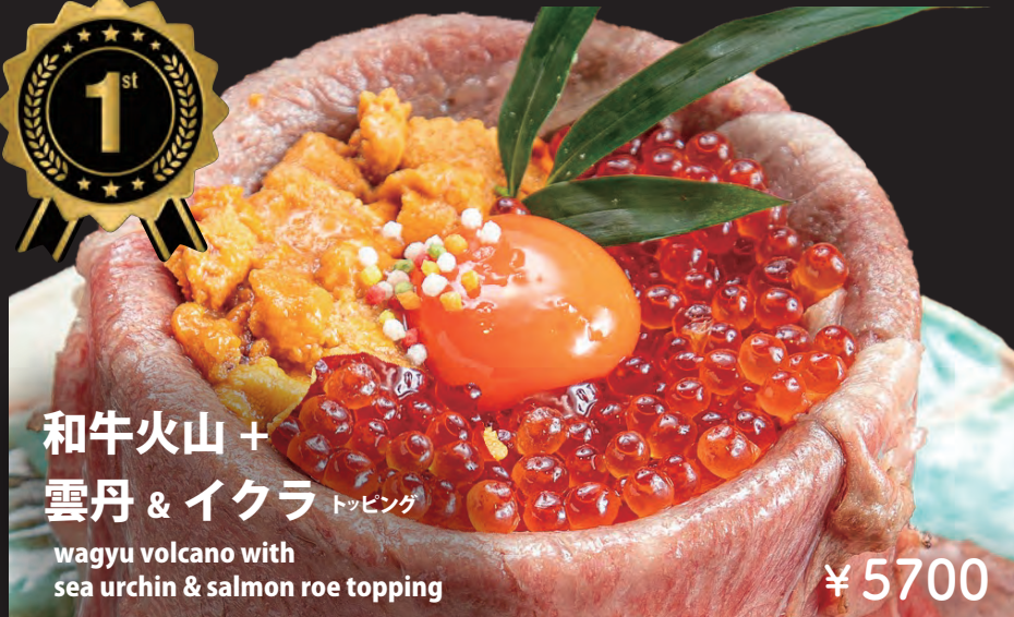
和牛火山 + 雲丹 & イクラ トッピング

wagyu volcano with sea urchin & salmon roe topping