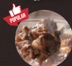
和牛爆弾 Wagyu Bomb