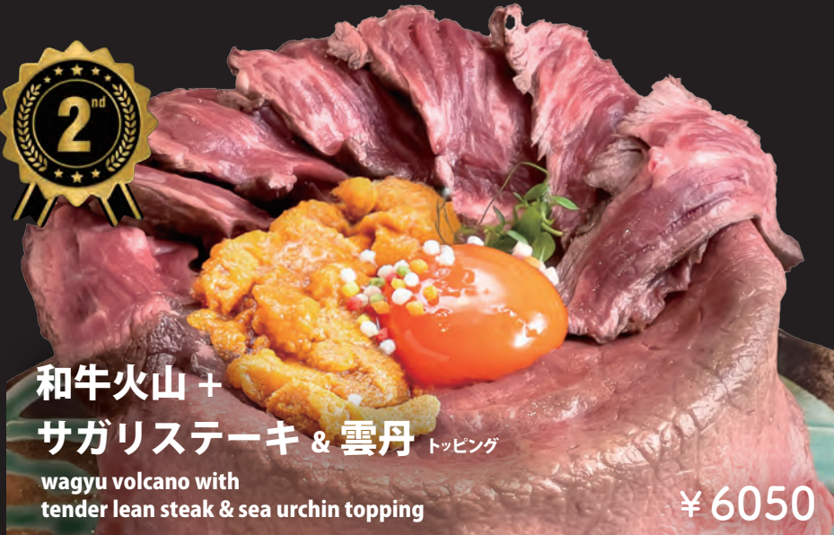
和牛火山 + サガリスステーキ & 雲丹 トッピング

wagyu volcano with tender lean steak & sea urchin topping