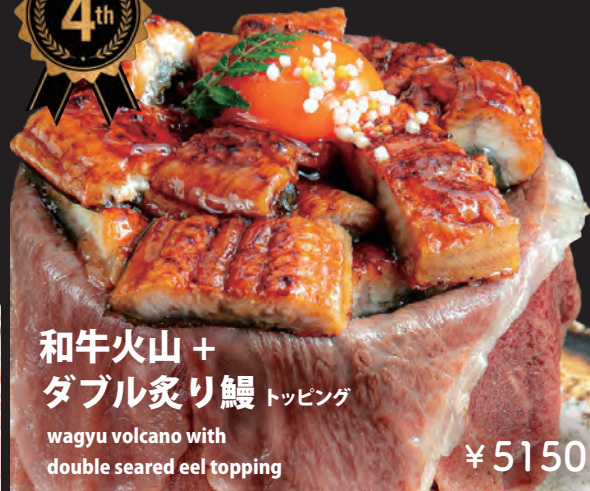
和牛火山 + ダブル炙り鰻 トッピング

wagyu volcano with double seared eel topping