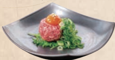
with Kyoto Leek 九条ネギ