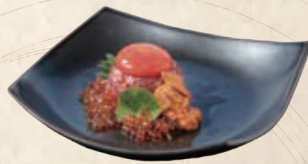
with Salmon Roe & Sea Urchin 雲丹イクラ