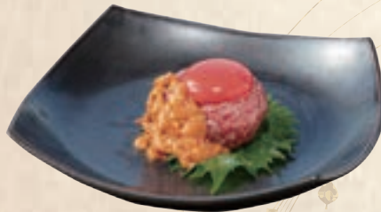
with Sea Urchin 雲丹