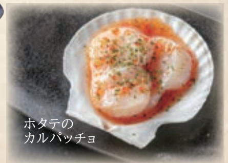
ホタテの カルパッチョ