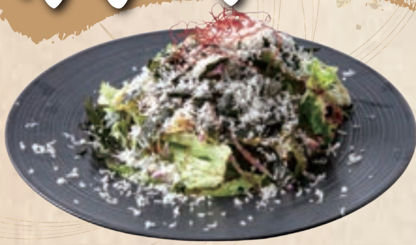
チーズチョレギサラダ