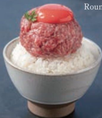
Round Yukhoe Rice Bowl