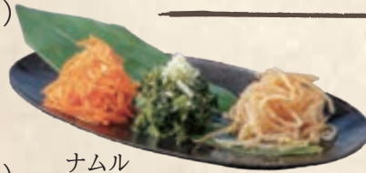
ナムル 盛り合わせ