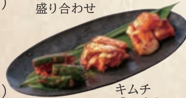
キムチ 盛り合わせ