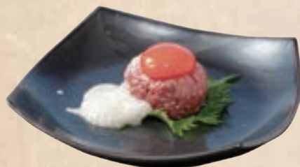
with Grated Yum とろろ