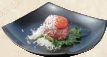
with Freshly-grated Cheese 削りチーズ