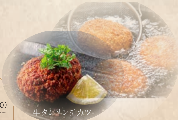
牛タンメンチカツ