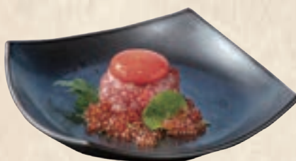
with Salmon Roe イクラ