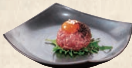
with Freshly-grated Truffle 削りトリュフ