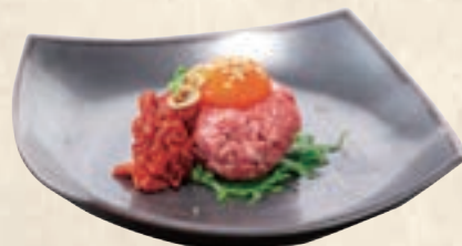
with Spicy Cod Guts チャンジャ