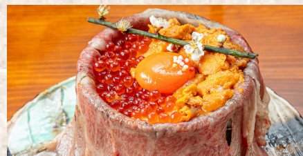
+ イクラ + 雲丹