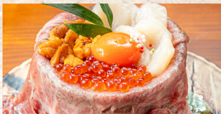
+ 雲丹 + ホタテ + イクラ