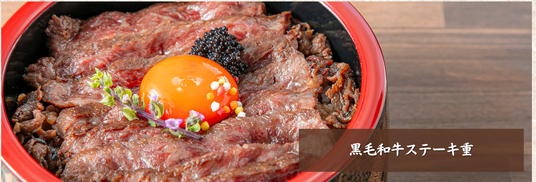
黒毛和牛ステーキ丼