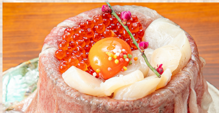
+ ホタテ + イクラ