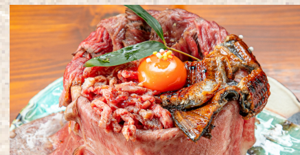
+ ステーキ + ユッケ + 鰻