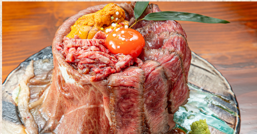
+ 雲丹 + ユッケ + ステーキ