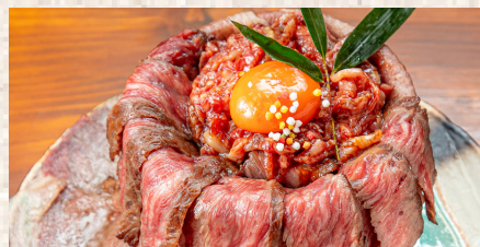
+ 特盛りステーキ + ユッケ