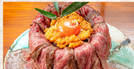
+ 特盛りステーキ + 雲丹